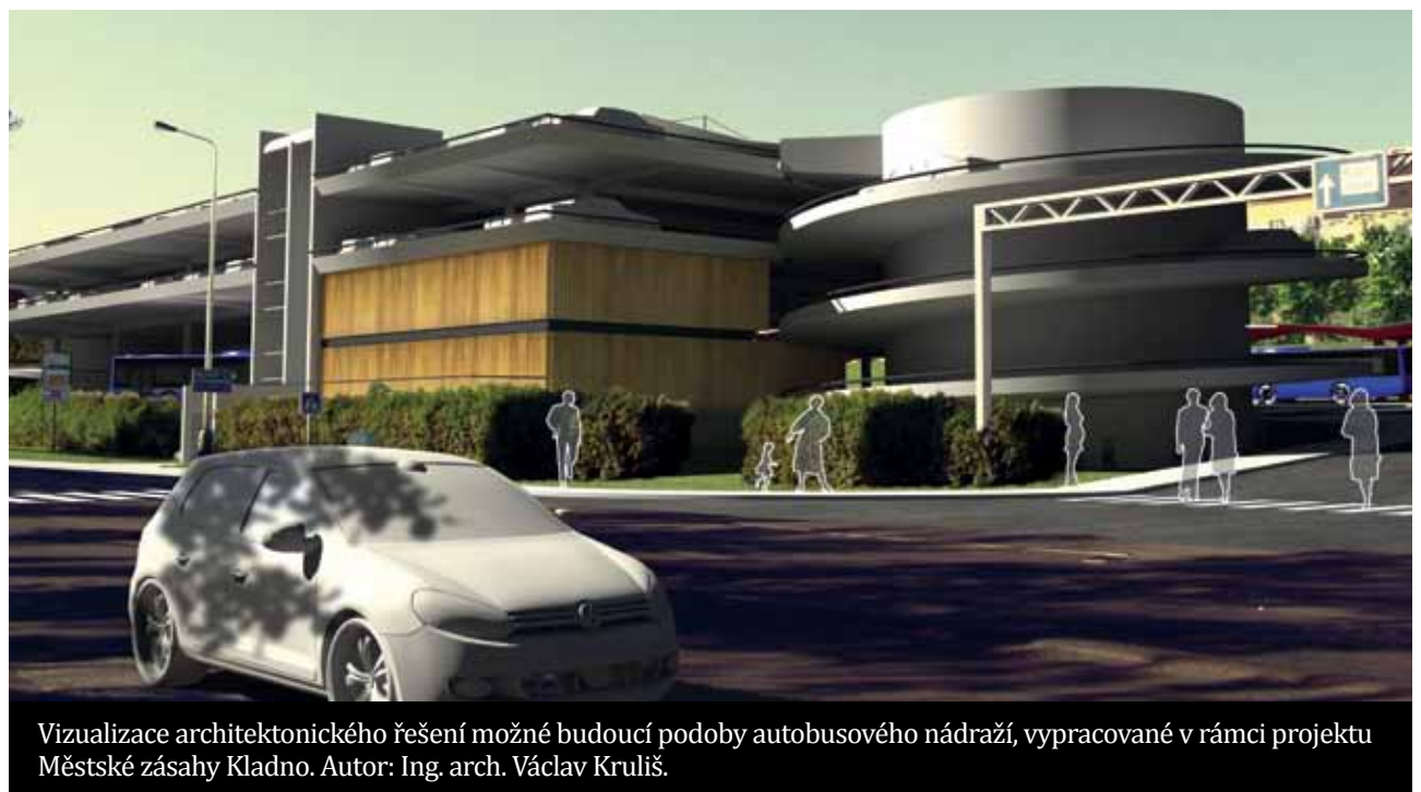
Vizualizace architektonického řešení možné budoucí podoby autobusového nádraží, vypracované v rámci projektu Městské zásahy Kladno. Autor: Ing. arch. Václav Kruliš.

Jedním z klíčových míst v centrální části Kladna je autobusové nádraží, na které se chce Volba pro Kladno soustředit. Navazujeme tak na minulé vydání našich novin, kde jsme v článku věnovanému centru města slíbili právě toto téma. Autobusové nádraží je přirozenou součástí pěší zóny, každý den tudy projdou tisíce lidí a jejich počet ještě vzroste s dokončením obchodního komplexu Central Kladno. Zatímco dopoledne je autobusové nádraží poměrně klidné, naprostý opak nastává dennodenně v odpoledních hodinách, kdy je toto obrovské množství lidí životně důležité pro pěší zónu. Z autobusového nádraží by nejen podle nás, ale i podle odborníků, měl vzniknout integrovaný dopravní uzel, jenž by pomohl nejen pěší zóně, ale také by usnadnil cestování meziměstskou i městskou veřejnou dopravou. Velká část autobusového nádraží se navíc nezměnila několik desítek let, rekonstrukci si zcela určitě zaslouží. Volba pro Kladno by proto chtěla, po poradě s architekty, vypsat architektonickou soutěž, ze které by vzešlo nejlepší řešení dané lokality.