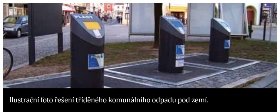
Ilustrační foto řešení tříděného komunálního odpadu pod zemí.

Komunální odpad pod zemí má kromě estetického přínosu i pozitivní dopad na frekvenci vyvážení sběrných nádob – dá se jednoduše přizpůsobit jednotlivým lokalitám a objemům, které tamní obyvatelé generují. Ani po technické stránce tento systém neznámá žádné problémy. Na závěr si, pro dokreslení, uvedeme jeden příklad z kladenské praxe. V minulém vydání jsme se věnovali pěší zóně, její součástí je vyústění do Poštovního náměstí, jež je už léta zakončeno právě kontejnerem a řadou popelnic. Kolem jdoucím nezbyvá nic jiného než poskakovat mezi odpadky, odhánět vosy a zadržet dech. Takových případů můžeme jistě uvést více, ovšem pokud by byl odpad pod zemí, problémy rázem zmizí a kvalita života v našem městě se výraznělepší!