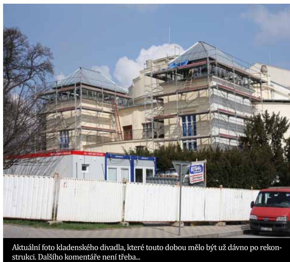
Aktuální foto kladenského divadla, které touto dobou mělo být už dávno po rekonstrukci. Dalšího komentáře není třeba...

Investor, tedy město, ani placený stavební dozor nijak nekonaly. 10. března 2014 vypršel další, již druhý termín pro dokončení stavby. Opět není žádný segment stavby dokončen úplně. Přístavba budovy doposud vůbec nezačala. Město celou dobu mělo informace o tom, že je stavba zásadně ve skluzu, přesto svolalo až 7. března mimořádnou radu města. Radní se podivili, že stavba není dokončena, a rozhodli, že situaci musí posoudit právníci a stanovit, co má Kladno jako investor dělat. Od 10. března stavba pokračuje beze smlouvy dál a svým, již tradičně, velmi pomalým tempem. Mimo jiné tak stále nebyly zahájeny práce na přístavbě budovy. Rada města stále nepřijala žádné opatření, pouze 17. března opět rozhodla, že chce další posudek právníků. Nekonečný příběh rekonstrukce kladenského divadla nekončí, jeho komentář není z našeho pohledu nutný a hodnocení tak necháváme na čtenářích a obyvatelích Kladna. Volba pro Kladno počká na výsledek, doufáme, že nebudeme muset, tentokrát již bez nadsázky, ve svém volebním programu opět uvést, že skutečně dokončíme rekonstrukci kladenského divadla.