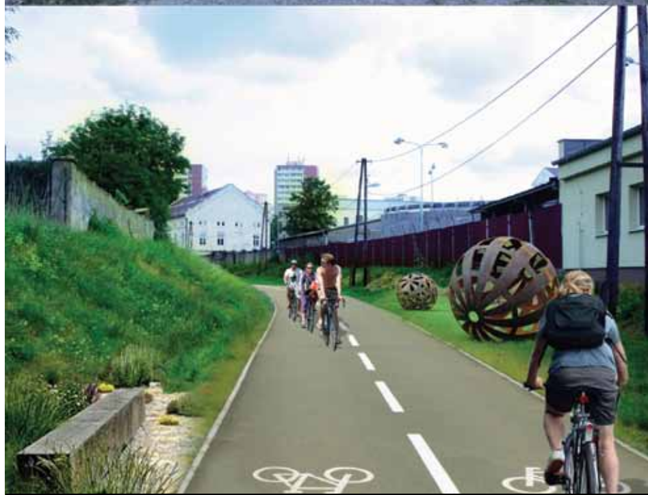
Znovuzrození kladenského semmeringu. Autoři: Ondřej Rys, Lenka Slívová.