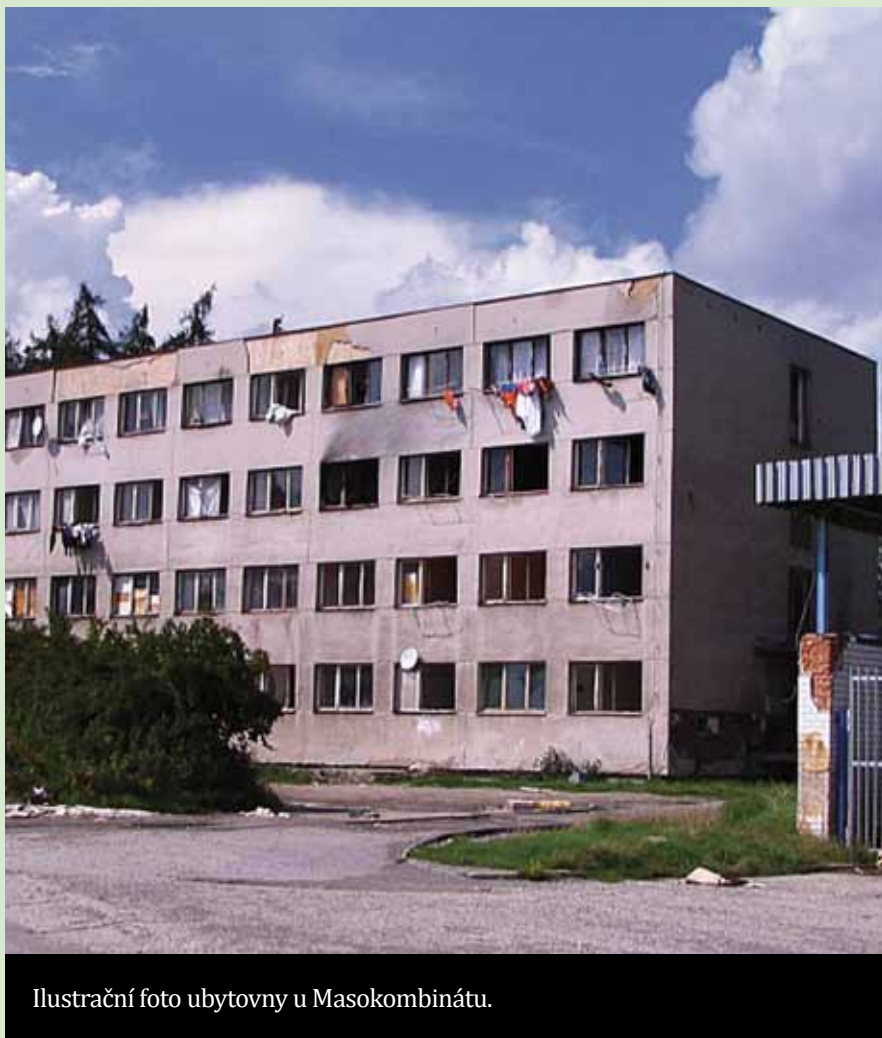
Ilustrační foto ubytovny u Masokombinátu.

Nejčastější dotaz v posledních týdnech dostáváme na možný příchod tisíců Romů.