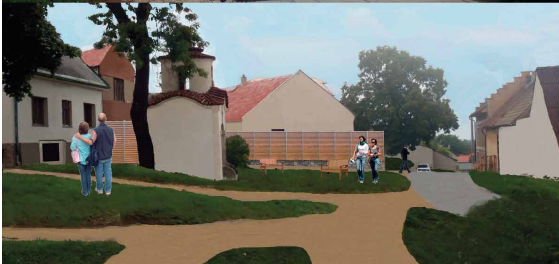
Udělat z křižovatky náměstí, uklidit popelnice a dát vyniknout kapli. Motyčín si to zaslouží. Autor: Václav Kruliš