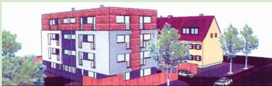
Tahle příšernost vyrostle před okny Kladeňáků, kteří si zprivatizovali domy od města v původně klidné a velmi pěkné zástavbě vedle ulice M. Horákové.