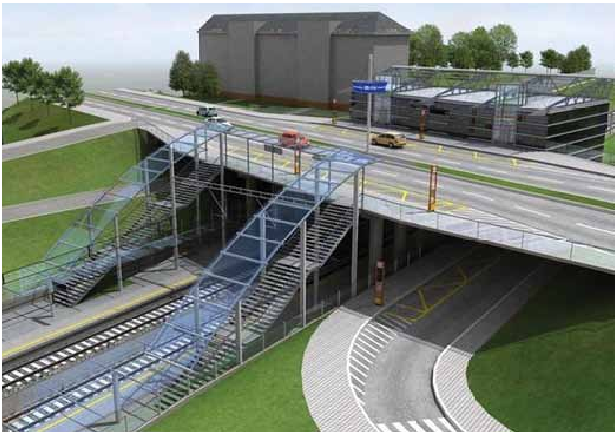
Rychlodráha je zatím projekt budoucnosti, který ale není nerealizovatelný. Takto by v budoucnu měla vypadat nástupní stanice u nemocnice. Návrh realizoval Metroprojekt Praha a.s.

Nároky na dopravu v Kladně jsou vysoké. Jedině ucelená koncepce ale může tuto problematiku vyřešit a naplnit vizi dopravy, která se stane příjemnou součástí našeho života a zlepšení jeho kvality. Takový je i cíl Volby pro Kladno.