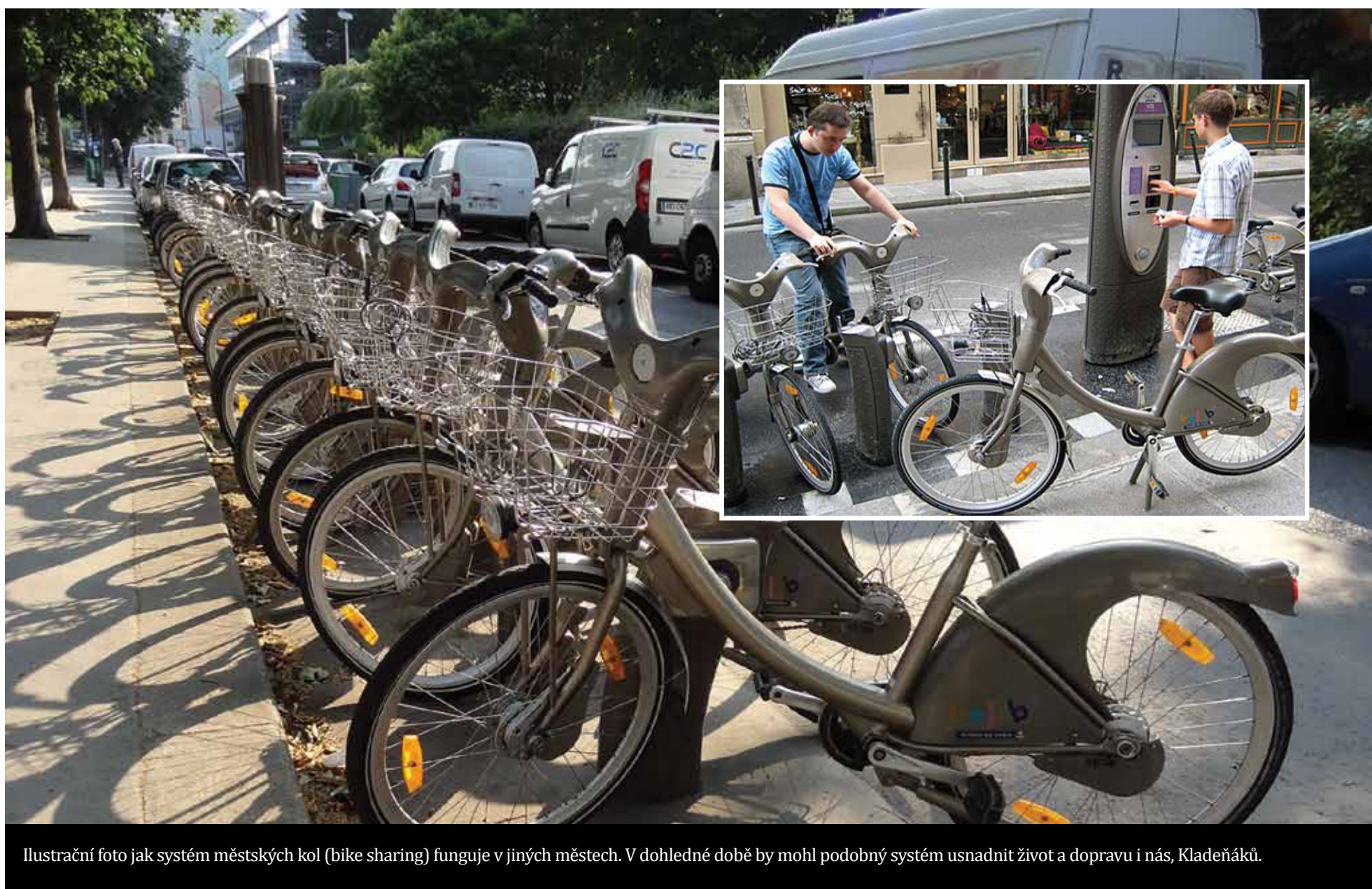
Ilustrační foto jak systém městských kol (bike sharing) funguje v jiných městech. V dohledné době by mohl podobný systém usnadnit život a dopravu i nás, Kladeňáků.

Při dnešní oblibě a rozšíření cyklistiky lze počítat s tím, že i tento způsob dopravy bude stále častěji využíván. Kladnu naprosto chybí síť vnitřních cyklostezek, na nichž je třeba zapracovat. Základním parametrem je fakt, že by cyklo doprava měla být bezpečná pro všechny věkové kategorie. Samozřejmostí je instalace stojanů pro kola v celém městě, jakož i zastřešených „parkovišť“ pro kola. Už v minulém dopravním programu figuruje návrhovaní systém městských kol – bike sharing. Není novinkou, funguje v řadě zahraničních měst a pomalu se rozšiřuje například i v některých městských částech v Praze. Načem je založený? Základem jsou stojany, na kterých jsou