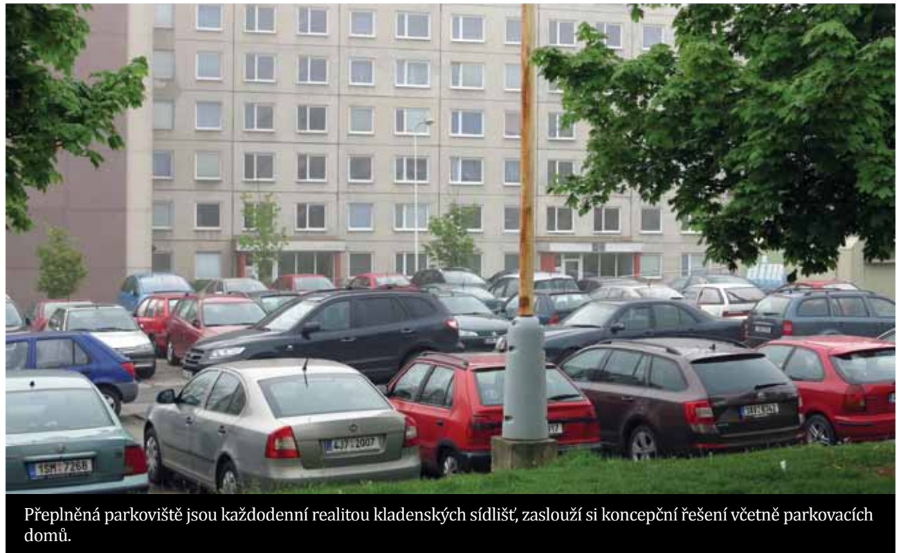
Přeplněná parkoviště jsou každodenní realitou kladenských sídlišť, zaslouží si koncepční řešení včetně parkovacích domů.

Každý obyvatel se denně potýká s dopravní situací ve městě, má své vlastní zkušenosti a vidí palčivá místa, která je potřeba vyřešit. K takovým patří nedostatečná kapacita parkovacích míst, nedostatečné intervaly autobusů, špatná dostupnost některých lokalit či absentující vnitřní síť cyklostezek a nedostatečná prostupnost.